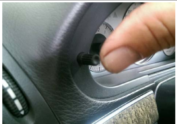
快速按壓三次按鈕