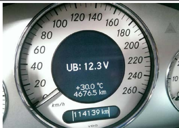
儀表會有蜂鳴聲，並出現電壓