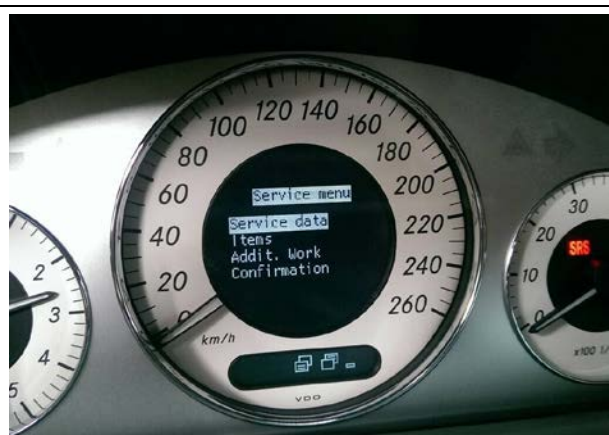
進入 Service Menu