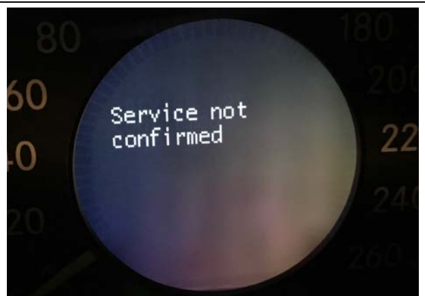
若網關電腦故障，會導致歸零失敗