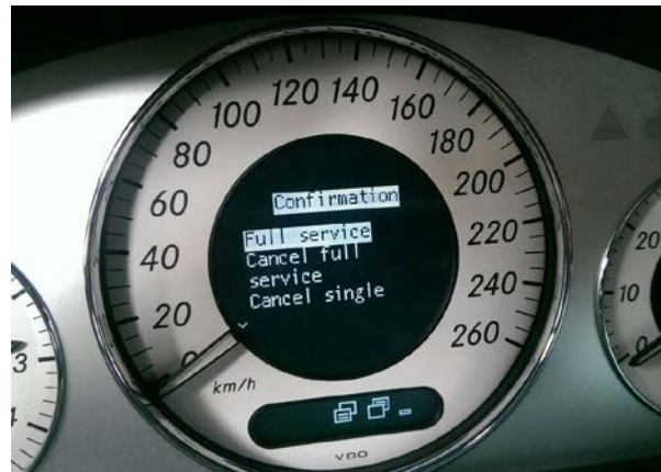
選擇 Full Services ，進行歸零，將會有下列兩種狀況