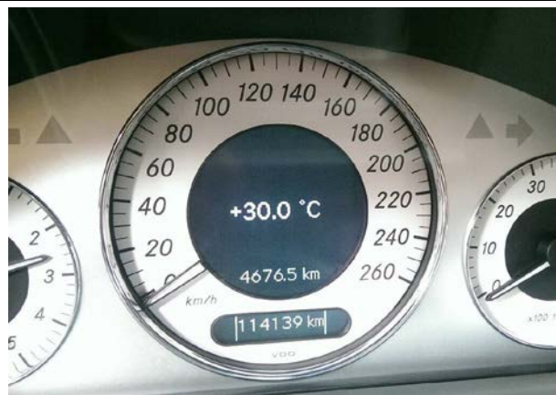
鑰匙開第一段，使儀表出現室外溫度